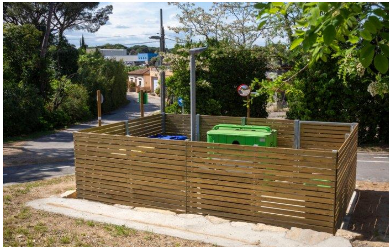
Figura 3. Àrea tancada de reciclatge per al veïnat de l'Estació a Riudellots de la Selva.

D'altra banda, les masies i els nuclis disseminats pertanyents als municipis, compten amb un sistema de recollida alternatiu basat en 3 àrees d'aportació tancades amb control d'accés mitjançant una clau individual.