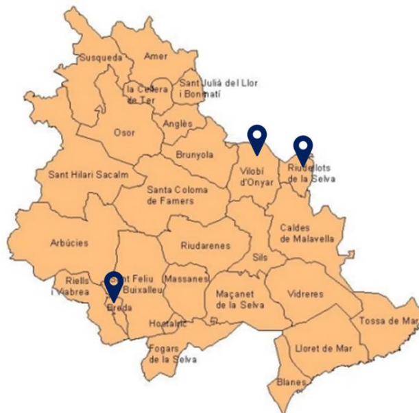
Figura 1. Mapa de la comarca de La Selva; remarcats ambdós municipis a tractar.

La comarca de la Selva està formada per vint-i-sis municipis que engloba una població de 182.614 habitants 1 . L'ens local té delegada la competència de la recollida selectiva al Consell Comarcal on l'entitat encarregada de la gestió de residus de la comarca és NORA, S.A. la qual, al 2017, va iniciar el servei de recollida porta a porta a nivell domiciliari en la majoria de municipis d'interior de la comarca.