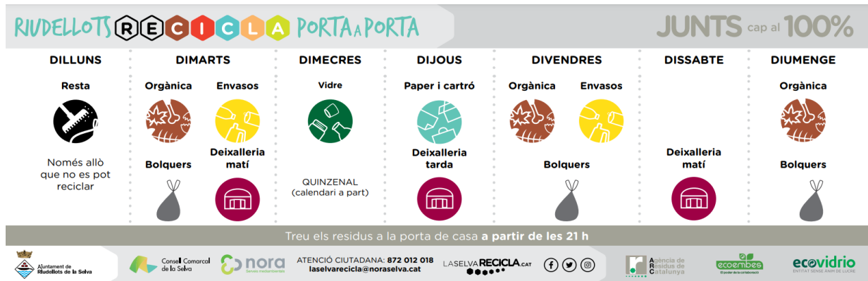
Figura 2. Calendari de la recollida porta a porta per al municipi de Riudellots de La Selva.

Concretament, els nuclis urbans de Riudellots de La Selva (2.087 habitants) i Breda (3.892 habitants) van instaurar aquest nou model de recollida a finals de novembre de 2017, i posteriorment, al 2023, es va instaurar a Vilobí d'Onyar (3.269 habitants), el qual inclou la recollida selectiva porta a porta de paper-cartró, envasos lleugers, vidre, residus orgànics i resta segons un calendari preestablert. Respecte els residus sanitaris domèstics es recullen en una bossa a part, identificada amb un adhesiu homologat que es proporciona des dels ens locals.