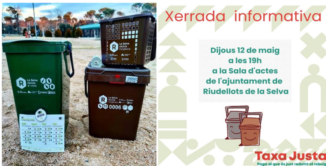
Figura 4. Nous cubells identificats amb xip per a la ciutadania (esquerra) i fulletó informatiu de la Taxa Justa (dreta).

Amb la finalitat d'informar a tots els agents implicats, es va posar en marxa una campanya de comunicació sota l'eslògan "Paga el que és just reduint el rebuig". Concretament, es van realitzar diferents xerrades informatives a les dependències municipals per tal de resoldre tots els aspectes relacionats amb la correcta gestió, bones pràctiques i dubtes generats envers el nou instrument fiscal. A més, es van editar i distribuir fulletons informatius per a cada tipologia d'usuari, així com calendaris, cartells i pancartes. També es van repartir circulars a cada habitatge i es va fer difusió a través dels butlletins municipals.