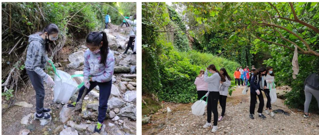
Figura 3. Tasques de neteja per part de l'alumnat.

Durant la jornada de recollida de residus, els alumnes s'organitzen per grups segons la fracció a recollir: paper-cartró, vidre, envasos lleugers o altres. El professorat s'encarrega de recollir els vidres i objectes punxants, per tal de garantir la seguretat dels alumnes. En aquest sentit, a cada grup se li entreguen bosses amb nanses i sacs de ràfia per a l'emmagatzematge de la fracció assignada, així com guants d'un sol ús (PLA) 3 o guants gruixuts, per poder recollir els residus complint amb els criteris de seguretat. Un cop finalitzada l'entrega de material i l'organització de l'alumnat, es proporcionen les instruccions de seguretat, que inclouen la utilització de guants i no recollir residus punxants ni tovallolletes higièniques per motius de salut, entre d'altres.