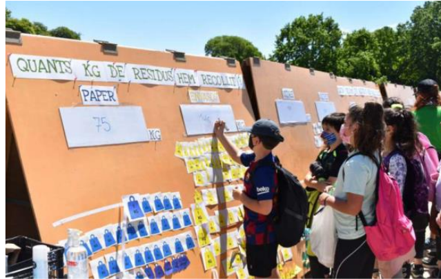
Figura 5. Alumnat creant l'espai de reflexió, amb dades i fotografies.