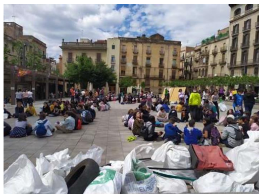
Figura 4. Reflexió grupal sobre els residus recollits als torrents de Valls.