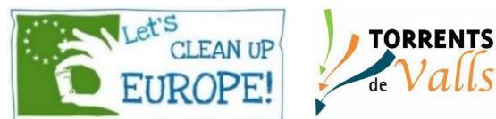
Figura 2. Logotips de la campanya "Let's Clean Up Europe" (esquerra) i del Projecte Torrents de Valls (dreta).

Concretament, en el marc de la iniciativa " Let's Clean Up Europe " (LCUE), l'any 2021 es va impulsar l'acció anomenada " Fem neteja als torrents! " des de l'Àrea de Sostenibilitat del consistori, amb la finalitat de realitzar la neteja del medi fluvial del municipi, així com la reflexió conjunta de la preservació de l'espai públic . En aquesta edició es van mobilitzar 11 centres educatius de primària i secundària del municipi que formen part del Programa Escoles Verdes 1 , per tal de desenvolupar tasques de neteja dels torrents de Valls. Així mateix, a la iniciativa també hi va participar l'entitat sense ànim de lucre " Projecte Torrents " 2 .