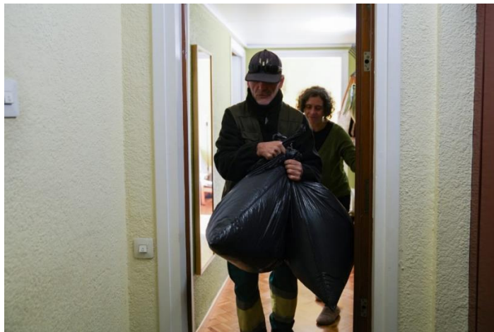
Figura 1. Solidança realitzant el servei porta a porta per recollir roba en un habitatge.

El servei de recollida funciona de dilluns a divendres, de 9h00 a 14h00 i de 15h00 a 19h00, i dissabtes, de 9h00 a 14h00 (diumenges i festius no hi ha servei).