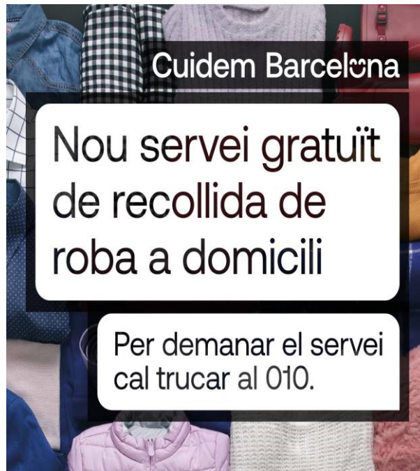
Figura 3. Cartell del nou sistema de recollida de roba a Barcelona.

Coincidint amb l'inici de la posada en funcionament del nou servei es va realitzar una campanya específica i es va difondre informació sobre el funcionament del nou servei de recollida a domicili a través dels principals canals de comunicació offline i online de l'Ajuntament de Barcelona, així com de les entitats que realitzen el servei de recollida.