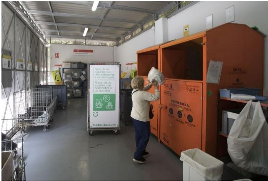
Figura 2. Contenedor de Roba Amiga ubicat a un punt verd de barri a Barcelona.

El personal d'ambdues empreses encarregades del servei de recollida a domicili dels residus tèxtils també s'encarreguen del buidatge dels contenidors situats tant a la via pública com a la xarxa de Punts Verds de la ciutat.