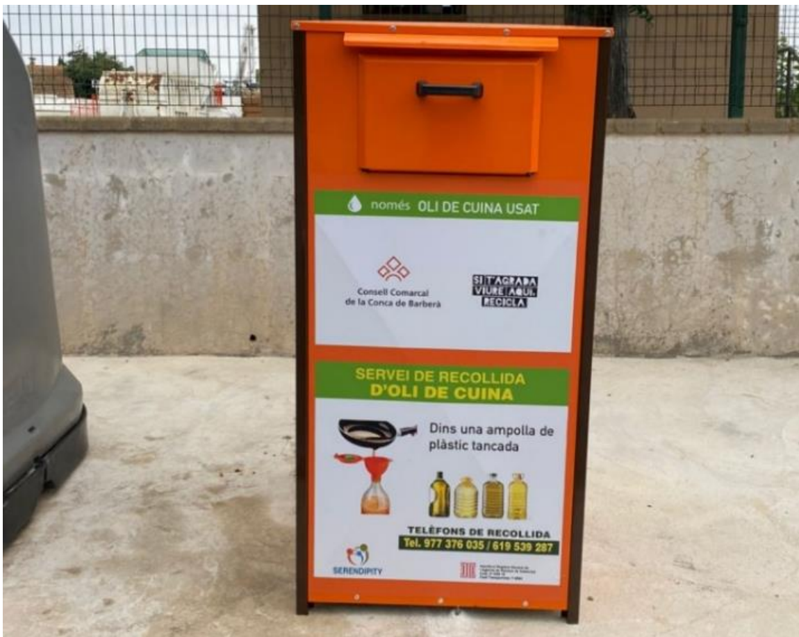
Figura 5. Contenidor a la via pública a la Conca de Barberà.

La instal·lació dels contenidors metàl·lics, de 360 litres de capacitat, s'ha realitzat en funció de la quantitat de població de cadascun dels municipis, tal i com es mostra a la següent taula: