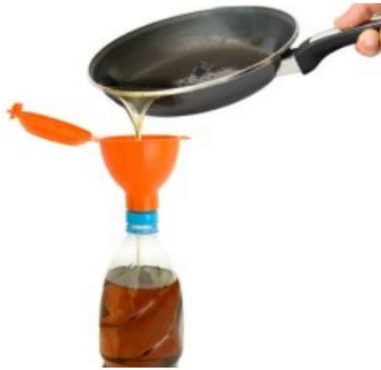
Figura 3. Inserció d'oli vegetal a una ampolla gràcies a un embut.

Aquesta iniciativa té per finalitat fomentar la recollida segregada d'oli usat a les cuines de les llars. Els objectius són: