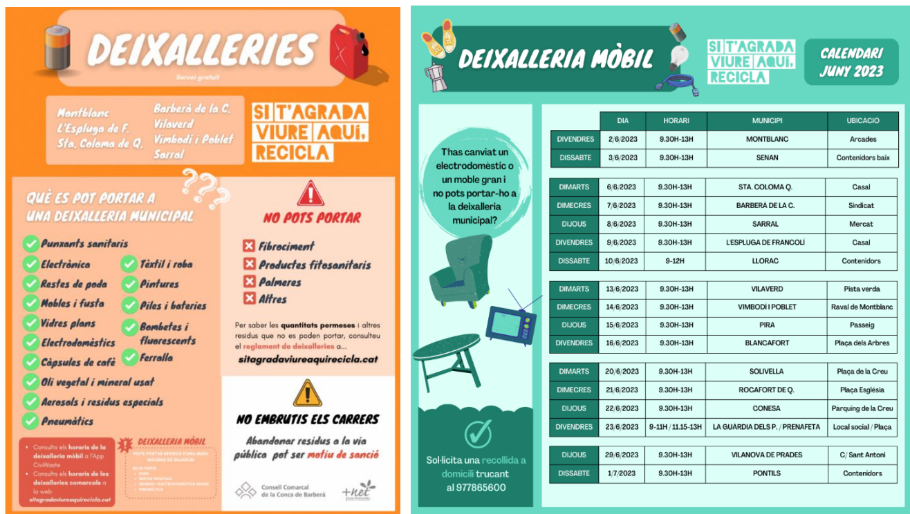
Figura 4. Calendari de pas de la deixalleria mòbil pels diferents municipis i els residus que s'hi recullen.

L'empresa Transports i olis Serendipity, S.L és l'encarregada de la gestió i el posterior aprofitament i valorització del residu, amb l'objectiu de transformar aquest flux en biodièsel. La mateixa empresa s'encarrega del buidatge i manteniment dels contenidors, amb periodicitat mensual.