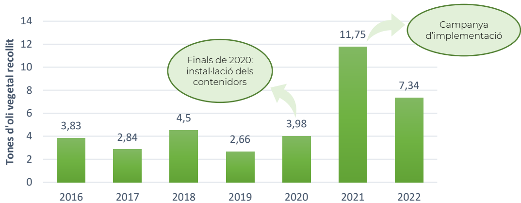
Figura 8. Evolució de les tones d'oli vegetal recollides a la Conca de Barberà.

Part de l'èxit d'aquesta iniciativa rau en la incorporació del flux de l'oli vegetal usat en la campanya del canvi de model de la recollida selectiva a nivell comarcal, posant de manifest la rellevància d'aquest residu vers la resta de fraccions selectives convencionals.