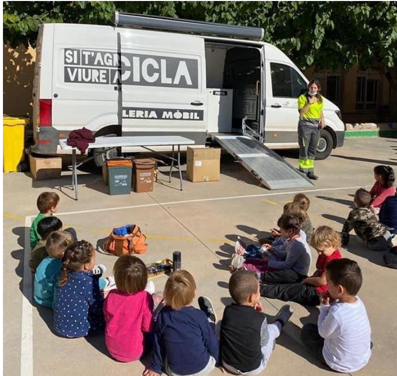
Figura 7. Tallers i Xerrades a les escoles a través de deixalleries mòbils.

Properament, per incentivar la participació dels comerços, es preveu lliurar bidons per separar l'oli, els quals seran recollits porta a porta per l'empresa que actualment s'encarrega del servei.