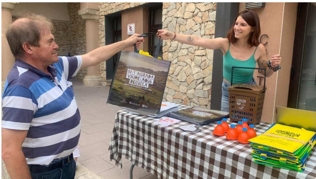
Figura 6. Fotografia d'una campanya de sensibilització de reciclatge i distribució d'embuts.

Així mateix, des del 2020 s'han fet un seguit d'activitats, xerrades i tallers sobre la recollida de l'oli vegetal per tal d'arribar a la població: