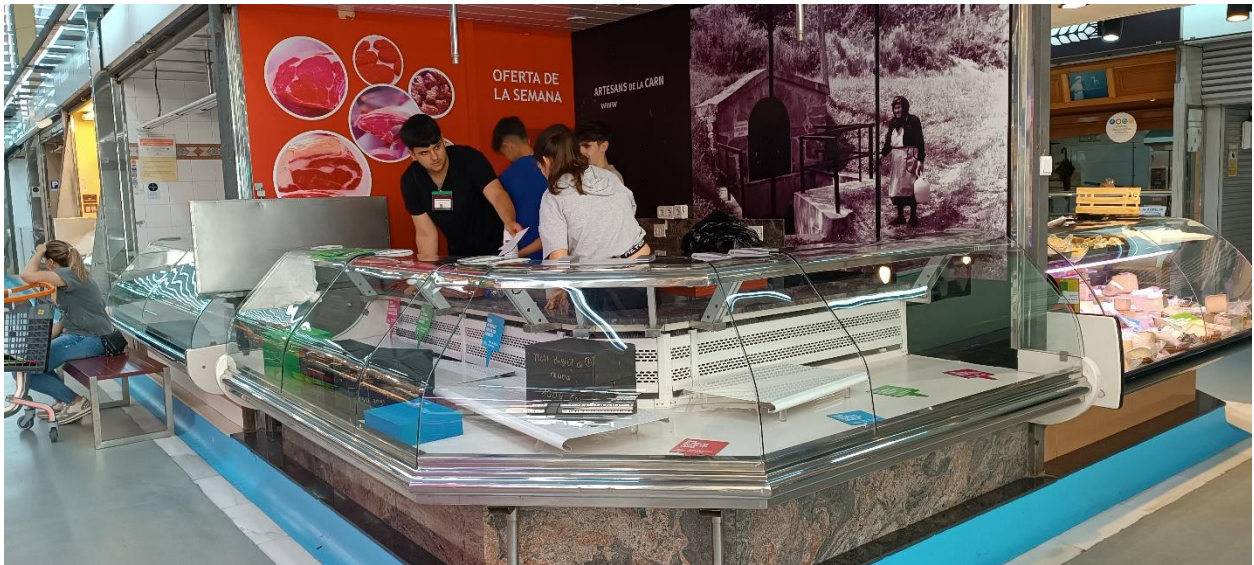
Figura 3. Parada amb informació sobre el temps de descomposició de diferents envasos d'un sol ús.