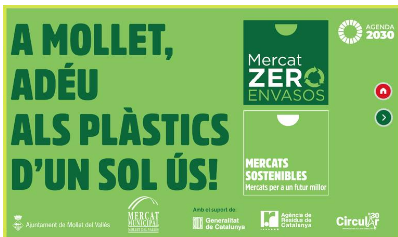
Figura 1. Cartell de la campanya Mercat Zero Envasos.

Mollet del Vallès és un municipi de la comarca del Vallès Oriental que té una població de 51.294 habitants 1 . Del 30 de març al 30 de juny de l'any 2023, amb el suport de la Diputació de Barcelona i l'Agència de Residus de Catalunya, es va iniciar una campanya per reduir l'ús de plàstics d'un sol ús al mercat municipal anomenada "A Mollet, adéu als plàstics d'un sol ús", amb la col·laboració de l'alumnat de 3r d'ESO de l'Institut Aiguaviva i emmarcada en la iniciativa "Mercat Zero Envasos".