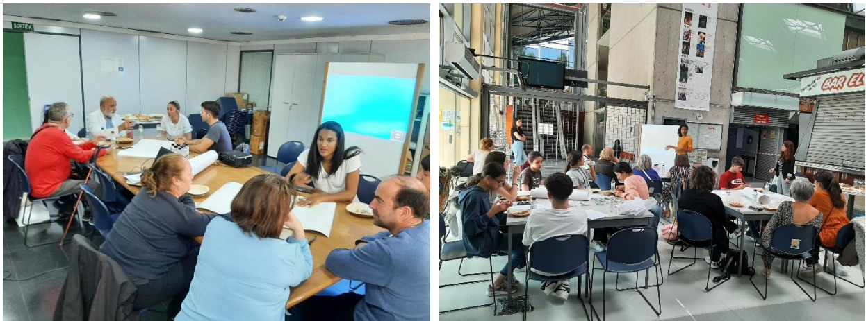
Figura 2. Primera (esquerra) i segona (dreta) sessions de cocreació.

La segona fase , anomenada Creació d'una campanya de comunicació , va tenir la finalitat de difondre i conscienciar sobre la necessitat de canviar d'hàbits a l'hora de fer la compra i animar a la ciutadania a comprar al mercat amb els seus propis envasos i bosses reutilitzables. Aquesta fase, va ser desenvolupada per l'alumnat de l'institut implicat en la campanya, i va consistir en les següents accions: