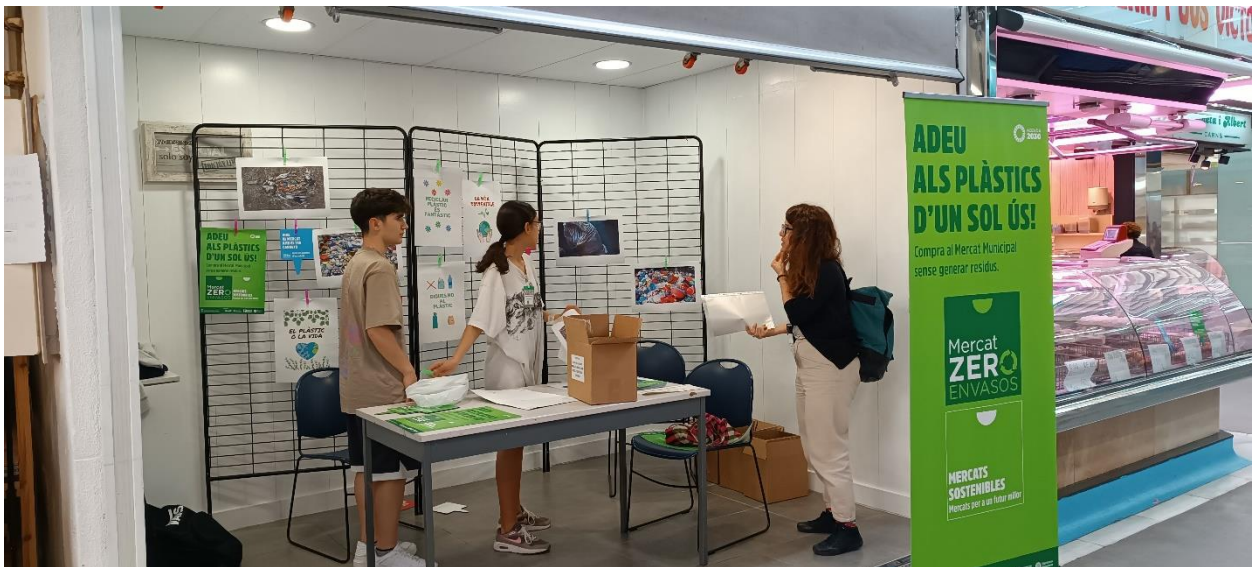
Figura 4. Punt d'informació al mercat.