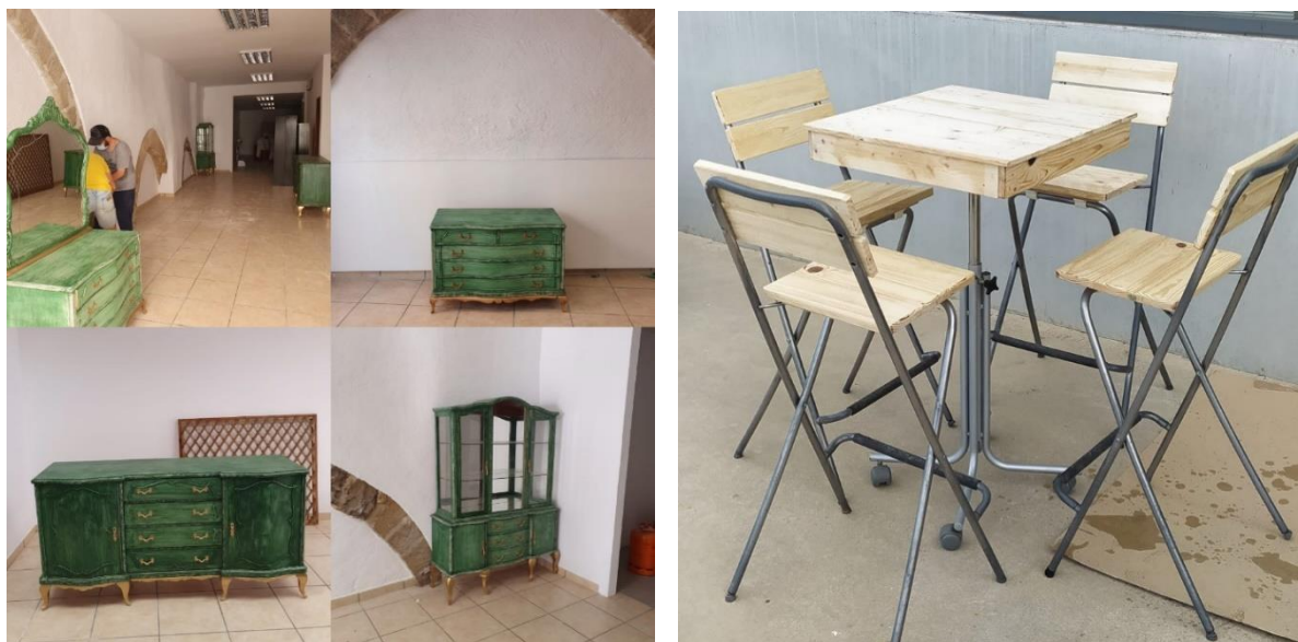
Figura 2. Imatges de mobiliari creat a partir de residus extrets de la deixalleria.

Així mateix, l'empresa també ofereix la possibilitat de recuperar o reformar mobiliari que els ciutadans aportin. El cost econòmic d'aquest treball variarà en funció de les hores de mà d'obra que s'han emprat per a la reforma del producte sol·licitat.