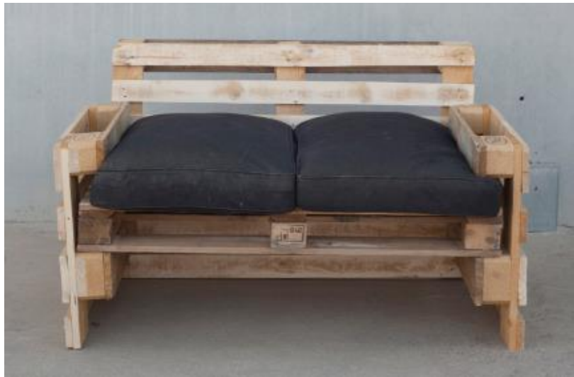
Figura 5. Imatge d'un sofà fet per palets i coixins de la marca Upcycled Cartaes

La combinació d'ambdues marques d' upcycling busca aconseguir productes amb millors resultats. La complementació de diferents residus recuperats i transformats juntament per a la formació d'un sol producte ofereix un salt qualitatiu en la producció de nou mobiliari.