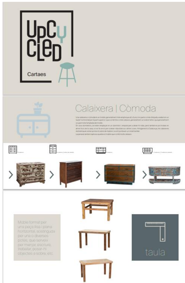
Figura 3. Imatge del catàleg d'Upcycled Cartaes.

La varietat dels productes oferts és molt àmplia, en els quals s'inclouen taules, cadires, estructures pels gegants del poble, parcs infantils, cuines de joguina, arbres de Nadal, prestatgeries, electrodomèstics, etc. Tots aquests productes es poden consultar en el catàleg que Cartaes disposa en la seva pàgina web, amb l'objectiu de poder-los vendre a tothom que estigui interessat.