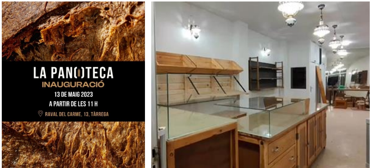
Figura 4. Imatge del fullletó informatiu sobre la inauguració del forn de pa La Panoteca i imatge de la fase final de la seva construcció. Font: Cartaes, 2023.

En el marc d'aquesta iniciativa, el passat 13 de maig es va inaugurar La Panoteca , una fleca de pa el mobiliari del qual ha estat fabricat en el taller de fusteria d' upcycling . Per a aquest mobiliari, s'han utilitzat fustes i mobles vells procedents de la deixalleria que en un inici estaven destinats com a rebuig, així com també s'ha recuperat mobiliari antic dels propietaris del forn. L'actuació s'ha completat en un període de 3 mesos, mitjançant el treball del fuster titular de l'empresa i de 2 persones amb contracte d'inserció social.