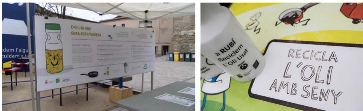
Figura 4. Punts informatius des d'on es reparteixen fulletons informatius i envasos estandarditzats per al foment de la recollida selectiva d'oli vegetal usat. Font: APDIR, 2021.

Respecte a les campanyes de difusió, es realitzen de forma periòdica conjuntament amb Rubí Net, entitat encarregada del servei de prevenció i gestió de residus de l'Ajuntament de Rubí. En aquest sentit, es distribueixen fulletons informatius i envasos durant la participació en jornades i fires de medi ambient com, per exemple, la Fira del Dia de la Terra.