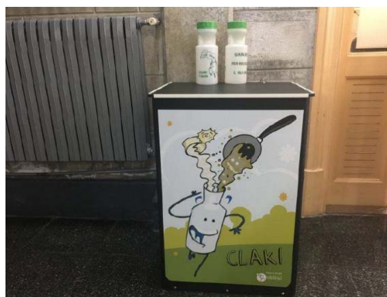
Figura 3. Punt de recollida d'oli vegetal usat establerts a un centre educatiu de Rubí en el marc del projecte Rubiclac.

Concretament, tots els centres escolars (escoles i instituts) de Rubí, a través d'un acord amb l'Ajuntament, participen en la iniciativa, en línia amb els objectius del projecte escoles verdes. Això no obstant, cada centre ha adaptat l'activitat a les seves possibilitats, fent participis tant als alumnes com a les famílies, així com d'altres sectors associats a la comunitat educativa (menjador, neteja, professorat, etc.).