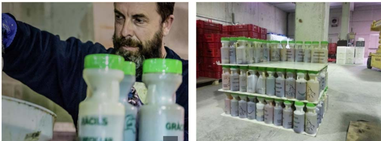
Figura 5. Nau per al rentat dels envasos estandarditzats i gestió de l'oli vegetal usat de Nou Verd (actual Entrem), ubicada a Vilafranca del Penedès.

Entre els serveis que s'ofereix per part de l'entitat es troba la recollida i gestió de l'oli vegetal usat de la ciutadania en general a través dels centres educatius i d'establiments privats pertanyents a l'hostaleria. En aquest sentit, es focalitzen en centres escolars, distribuint-se a cada alumne un envàs estandarditzat, facilitant el dipòsit de l'oli vegetal usat a les llars. Una vegada ple, l'alumne el retorna a l'escola lliurant-li un altre envàs de buit. Periòdicament, treballadors de la cooperativa Nou Verd recullen l'oli usat de les escoles, fent-se càrrec del buidatge, el transport, higienització dels envasos estandarditzats i valorització de l'oli usat. Mitjançant aquesta iniciativa s'han permès consolidar 4 llocs de treball per a persones amb necessitats especials i en risc d'exclusió dins la cooperativa.