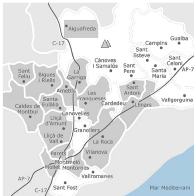
Figura 9. Mapa de la comarca del Vallès Oriental on es destaquen en gris els municipis participants actualment en el projecte OLINET.

serveis es troba OLINET, un projecte de recollida d'oli de cuina usat a través d'envasos estandarditzats a Santa Eulàlia de Ronçana i municipis de la comarca del Vallès Oriental.