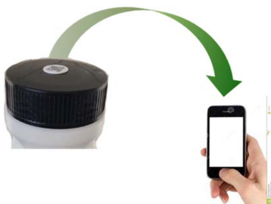
Figura 8. Incorporació del xip NFC a l'envàs estandarditzat.

Es preveu que durant el present any 2021, es realitzi la incorporació d'un xip NFC a l'envàs estandarditzat per tal que a través d'un dispositiu mòbil es pugui conèixer la traçabilitat de l'envàs. Per exemple, es podran consultar els litres recollits d'oli vegetal usat i tenir accés a estadístiques per avaluar el rendiment de l'envàs, enllaços directes als punts de recollida establerts (centres educatius, equipaments municipals, empreses privades, etc.),