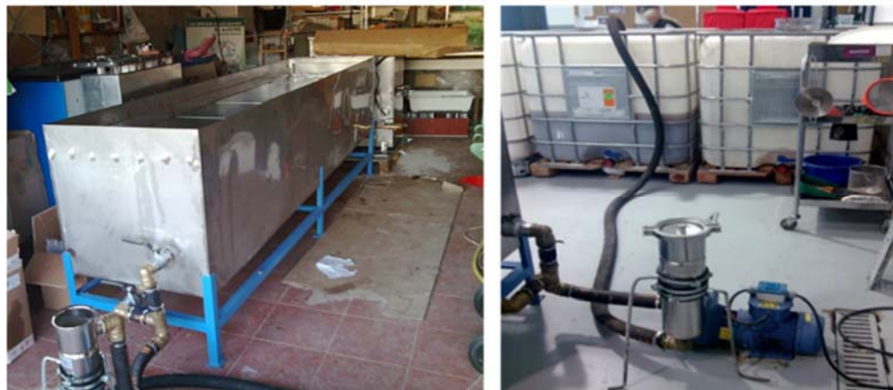
Figura 7. Tanc de buidatge de l'oli vegetal usat (esquerra) i sistema de bombament i filtratge de l'oli usat (dreta). Font: Igualssom, 2021.

Es preveu que durant el present any 2021, es realitzi la incorporació d'un xip NFC a l'envàs estandarditzat per tal que a través d'un dispositiu mòbil es pugui conèixer la traçabilitat de l'envàs. Per exemple, es podran consultar els litres recollits d'oli vegetal usat i tenir accés a estadístiques per avaluar el rendiment de l'envàs, enllaços directes als punts de recollida establerts (centres educatius, equipaments municipals, empreses privades, etc.),