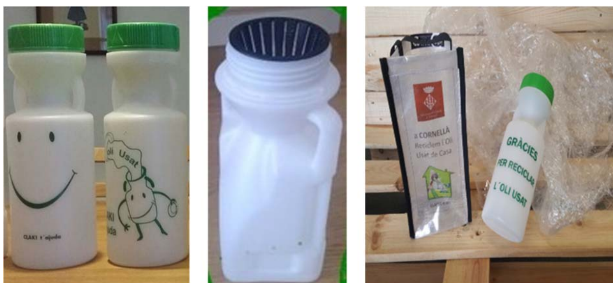
Figura 2. Disseny de l'envàs estandarditzat (esquerra), embut que filtra els sòlids que pugui contenidor l'oli vegetal usat (centre) i la bossa de transport de l'envàs (dreta).

L'envàs estandarditzat, d'un litre i mig de capacitat, ha estat dissenyat amb unes característiques tècniques concretes per tal de facilitar la segregació en origen d'aquest residu. Addicionalment, a vegades l'envàs es lliura conjuntament amb un embut especial que permet separar els elements sòlids de l'oli vegetal usat i una bossa fabricada amb plàstic recuperat per a transportar l'envàs de forma còmoda i higiènica.