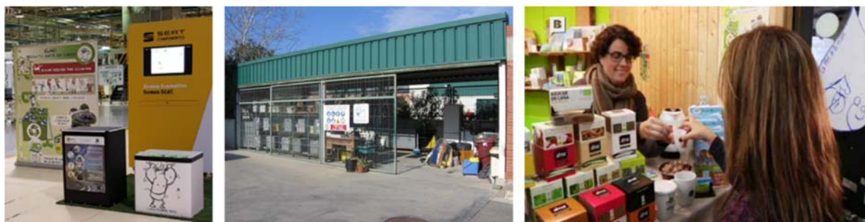
Figura 1. Punts de recollida d'envasos estandarditzats establerts a la fàbrica de SEAT (esquerra), a la deixalleria fixa (centre) i a un establiment comercial (dreta).

L'envàs estandarditzat, d'un litre i mig de capacitat, ha estat dissenyat amb unes característiques tècniques concretes per tal de facilitar la segregació en origen d'aquest residu. Addicionalment, a vegades l'envàs es lliura conjuntament amb un embut especial que permet separar els elements sòlids de l'oli vegetal usat i una bossa fabricada amb plàstic recuperat per a transportar l'envàs de forma còmoda i higiènica.