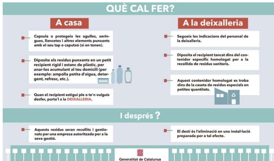
Figura 2. Cartell de difusió d'informació relacionada amb la gestió d'agulles i punxants.

La implementació en les diferents deixalleries de la comarca es va realitzar seguint les mesures de seguretat que aquesta fracció necessita segons l'Agència de Residus de Catalunya (ARC). Després de la col·locació dels contenidors, acompanyats dels seus pertinents cartells amb la informació necessària segons l'ARC, es va instruir als corresponents operaris per a poder oferir un servei segur i eficaç.