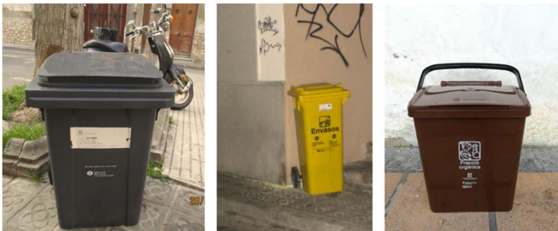
Figura 2. Exemples de models de contenerització cedits per a la recollida comercial de fracció resta (esquerra), envasos lleugers (centre) i fracció orgànica (dreta).

L'import fix de la taxa s'ha d'abonar trimestralment, mentre que el variable semestralment.