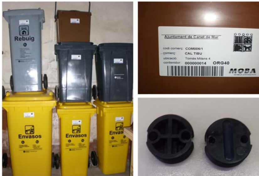
Figura 3. Identificació mitjançant codi de barris i xips dels bujols cedits per a la recollida comercial de residus. Font: Ajuntament de Canet de Mar, 2021.