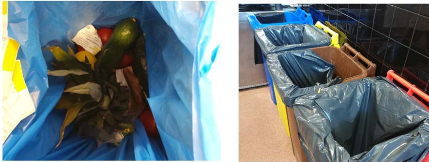
Figura 1. Sistema de control, vigilància i sanció de l'Ajuntament de Barcelona (I/II). Font: SIRESA, 2020.

Posteriorment, es realitza una segona visita on el personal de SIRESA va acompanyat d'un inspector de l'Ajuntament o de la Guardia Urbana i, en cas de persistir la infracció, es procedeix a obrir un expedient sancionador a l'establiment. Cal destacar que les inspeccions s'efectuen sense previ avís, notificant com a incompliment els casos on els establiments no permeten la inspecció. En aquest sentit, tot i que segons la normativa una sanció lleu pot ascendir fins a 3.000 €, l'import més habitual de les sancions oscil·la entre 150 i 300 €.