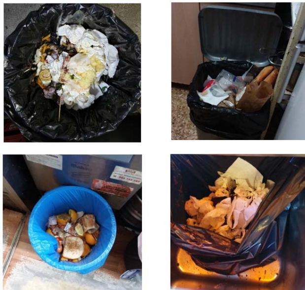
Figura 2. Sistema de control, vigilància i sanció de l'Ajuntament de Barcelona (II/II).