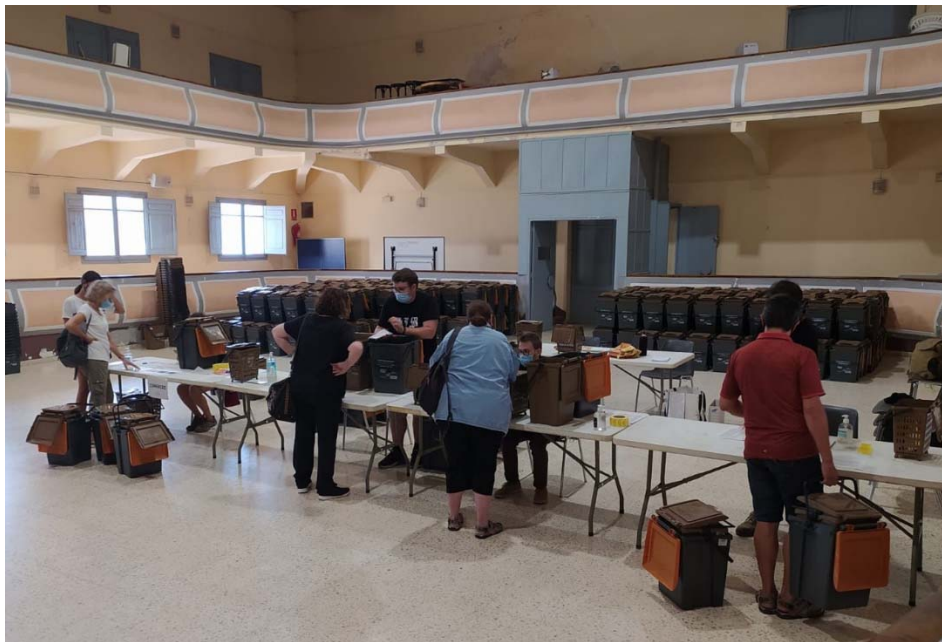
Figura 6. Punts informatius i d'entrega de material per al sistema porta a porta a Santa Coloma de Queralt.

Respecte a la recollida mitjançant contenidors tancats per a la fracció resta i orgànica, es duu a terme als municipis petits i als nuclis agregats de municipis més grans. En aquest cas, els envasos lleugers, el vidre i el paper i cartró se segueixen recollint en contenidors oberts, mentre que la fracció orgànica i resta es recull en contenidors tancats amb control d'accés, que poden obrir-se amb una targeta magnètica o amb l'aplicació mòbil Civiwaste.