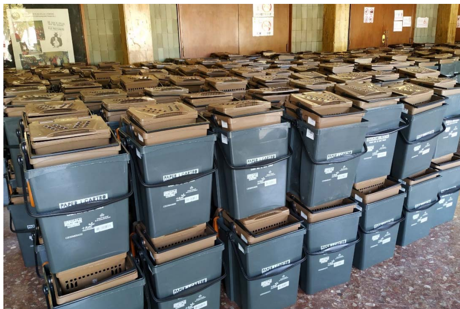
Figura 4. Cubells destinats a la recollida de residus porta a porta. Font: https://www.efmr.cat/blog/2020/10/18/especial-el-porta-porta-a-la-conca-de-barbera-del-diumenge-18-doctubre-del-2020/ , 2020.