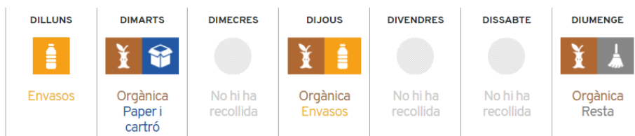
Figura 2. Calendari de la recollida domèstica a l'Espluga de Francolí.