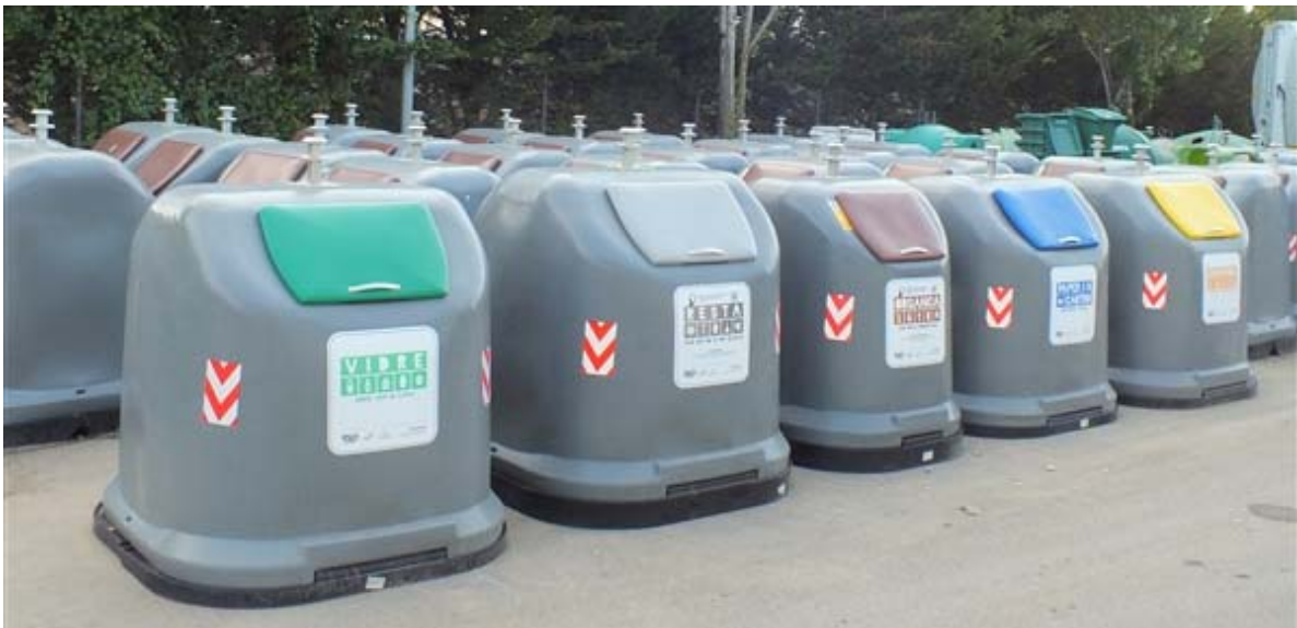
Figura 6. Nous contenidors destinats a la recollida de residus a la via pública.

En aquest context, els contenidors no tenen limitació de freqüència d'obertura i, a data octubre de 2020, no s'imposen sancions si s'obre cada dia el contenidor de resta, tot i que la intenció en un futur és limitar la seva obertura a dos cops per setmana. Tanmateix, cada municipi pot prendre les mesures corresponents segons les seves ordenances municipals sobre les taxes de residus, tal com es va dur a terme a Rocafort de Queralt arrel de la prova pilot amb contenidors tancats. En aquest municipi, es va elaborar una nova Ordenança fiscal reguladora de la taxa pel servei de recollida d'escombraries, on s'estableix la fixació de l'important tributari a pagar per cada habitatge en funció del nombre d'obertures anuals dels contenidors de rebuig i fracció orgànica 3 .