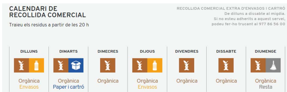
Figura 3. Calendari de la recollida comercial a l'Espluga de Francolí.