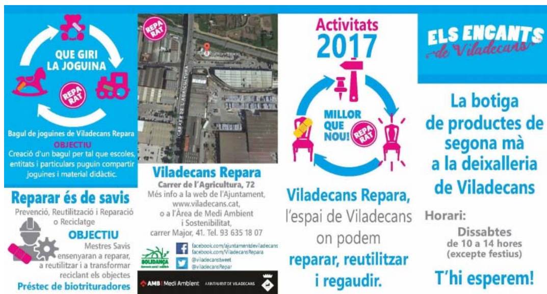
Figura 1. Projecte Viladecans Repara .

Viladecans és un municipi de la comarca del Baix Llobregat amb una població de 65.993 habitants (Idescat, 2017). Una de les iniciatives impulsades per aquest municipi és Viladecans Repara , un projecte subvencionat per l'Agència de Residus de Catalunya i desenvolupat dins la deixalleria municipal que comprèn un espai destinat a l'emmagatzematge d'elements aptes per a la reutilització o la preparació per a la reutilització, una zona amb eines a disposició dels usuaris de la deixalleria perquè puguin realitzar autoreparacions, així com rebre formació i assessorament sobre tècniques per reparar electrodomèstics, bicicletes, mobles, roba, etc.