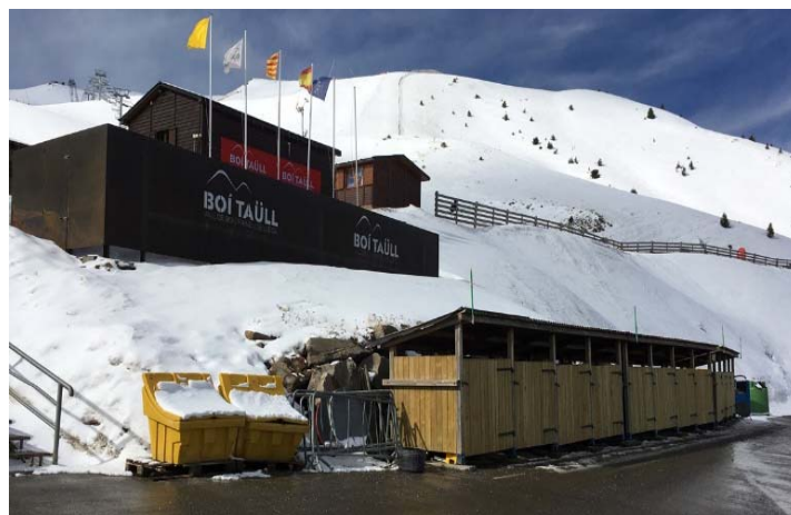
Figura 2. Punt de recollida de residus amb contenidors de gran volum a l'estació d'esquí de Boí Taüll (Alta Ribagorça).