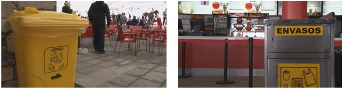
Figura 1. Contenidors de la fracció d'envasos lleugers a l'estació d'esquí de Boí Taüll (Alta Ribagorça).