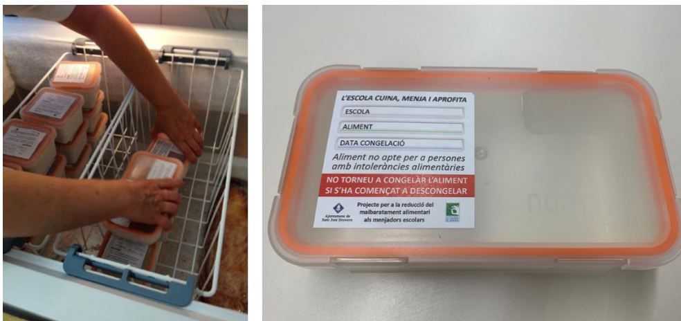
Figura 2. Carmanyoles aptes per congelar i escalfar al microones distribuïdes per l'Ajuntament de Sant Just Desvern. Font: Ajuntament de Sant Just Desvern, 2019.

El circuit d'aprofitament d'excedents funciona de la mateixa manera als centres educatius com a la residència Vitàlia: quan finalitza el servei de menjador, els aliments cuinats que no s'han servit es reparteixen en carmanyoles reutilitzables (aptes per ser congelades i pel seu ús al microones) que, prèviament han estat facilitades pel servei de Medi Ambient de l'Ajuntament. Seguidament, les carmanyoles s'etiqueten indicant la procedència de l'aliment, la tipologia (macarrons, verdura, etc.) i la data de congelació i es congelen a -18^{\circ}\text{C} en els mateixos centres. Així mateix, en l'etiquetatge s'informa sobre de la presència d'al·lèrgens i es fa especial menció a no tornar a congelar l'aliment en cas que aquest hagi començat a descongelar-se.