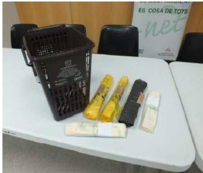
Figura 2. Kit format bosses identificades, cubell airejat i targeta magnètica.

Els contenidors compten amb un sistema de control d'accés mitjançant la identificació de l'usuari a través d'una targeta magnètica d'obertura. Aquest sistema de control es realitza a través de la comptabilització del nombre d'obertures del contenidor segons fracció, amb la finalitat de promoure l'ús correcte dels contenidors destinats a la recollida selectiva, fomentant un canvi d'hàbits entre la ciutadania. La iniciativa, permet la monitorització del servei de recollida incrementant així la seva eficiència.