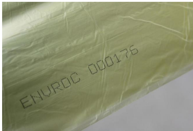
Figura 4. Bossa destinada a la fracció d'envasos lleugers identificada amb codi alfanumèric.

A més, la quota es regularà a partir de la realització d'inspeccions visuals (bosses dipositades fora del contenidor i bosses dipositades en contenidors incorrectes) i obertura aleatòria de bosses per tal de detectar si aquestes contenen impropis. Gràcies al codi alfanumèric que disposen les bosses d'escombraries es podrà identificar l'habitatge infractor.