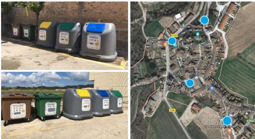
Figura 1. Àrees d'aportació i situació de les mateixes a Rocafort de Queralt.

Amb l'objectiu de fomentar l'increment de la recollida selectiva al municipi, durant el mes de juny de 2018 es va impulsar una prova pilot de sis mesos de durada amb contenidors d'obertura magnètica i identificació de bosses per a les fraccions de envasos lleugers, fracció orgànica i rebuig. La iniciativa compta amb contenidors que es troben repartits de manera equitativa al municipi en quatre àrees d'aportació.