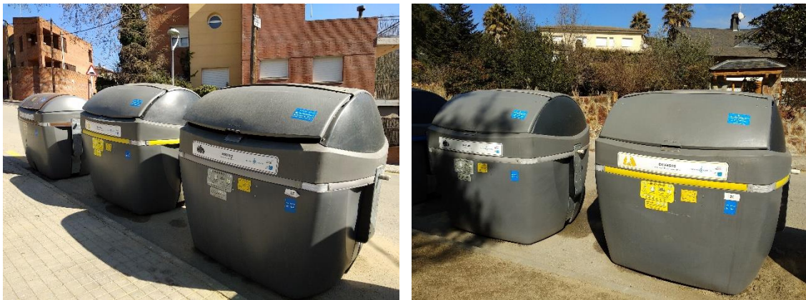
Figura 1. Contenidors tancats que disposen d'un sistema d'obertura mitjançant targeta magnètica.

Dosrius és un municipi del Maresme amb una població de 5.281 habitants (Idescat, 2018), format per tres nuclis urbans (Dosrius, Canyamars i Can Massuet) i molts habitatges disseminats. El juny de 2018, l'Ajuntament de Dosrius va iniciar una prova pilot, finançada gràcies a una subvenció d'Ecoembes, que ha consistit en el tancament dels contenidors de les fraccions envasos lleugers, orgànica i resta, els quals disposen d'un sistema d'obertura mitjançant targeta NFC. Es van tancar tots els contenidors d'aquestes tres fraccions (concretament 34 àrees i 102 contenidors).