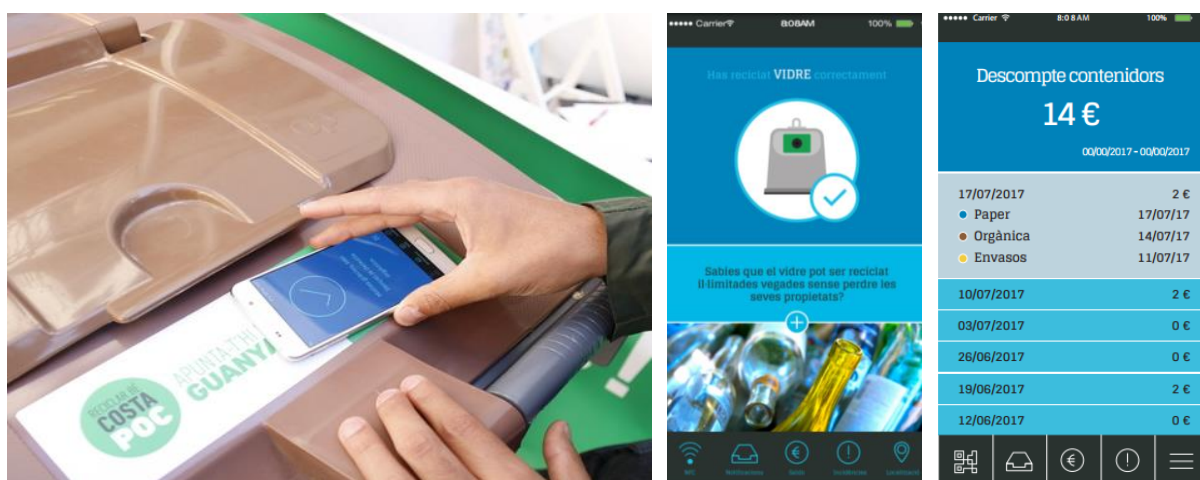
Figura 1. Aplicació de la Mancomunitat d'Escombraries de l'Urgellet.

dels residus, dades que s'envien automàticament a un servidor de la Mancomunitat. El ciutadà sap que la seva informació s'ha enviat correctament perquè el mòbil vibra, emet un so i mostra una pantalla informant de la fracció del contenidor on s'han dipositat els residus. Addicionalment, l'aplicació pot mostrar missatges de caràcter sensibilitzador, l'històric de lectures efectuades i el descompte setmanal obtingut, l'històric d'entrades a la deixalleria i el descompte setmanal obtingut, una safata per a la recepció de missatges, la comunicació d'incidències sobre els contenidors, informació de serveis i horaris, així com un joc sobre reciclatge.