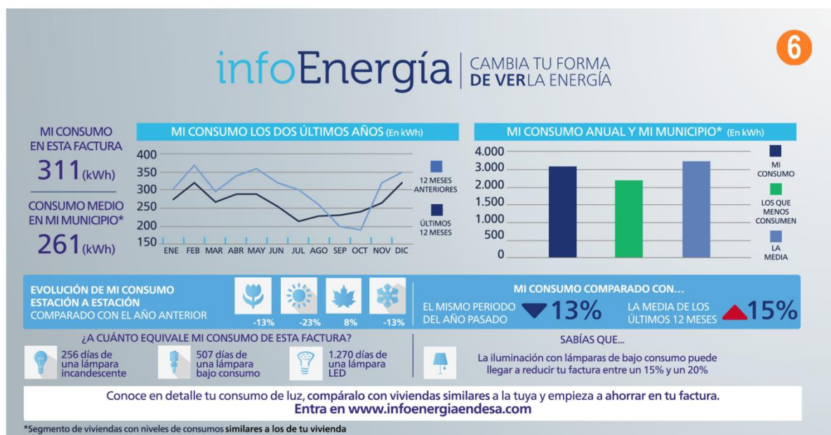
Figura 2. InfoEnergía: informació de caire sensibilitzador que incorpora la factura dels clients d'Endesa (comparació del teu consum d'electricitat amb el consum mitjà del municipi, evolució del teu consum estació a estació, comparació del teu consum actual amb el mateix període de temps que l'any passat i informació per promoure l'eficiència energètica).

Altres serveis oferts per empreses privades, com per exemple l'electricitat, l'aigua o el gas natural, també han optat per augmentar la informació que ofereixen als consumidors mitjançant la factura, incrementant així la transparència envers els ciutadans.