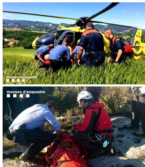
Figura 1. Nota de premsa de la Generalitat de Catalunya on s'informa que els Bombers de la Generalitat de Catalunya informaran del cost dels rescats realitzats.

Cerdanyola del Vallès, 1 d'octubre de 2008